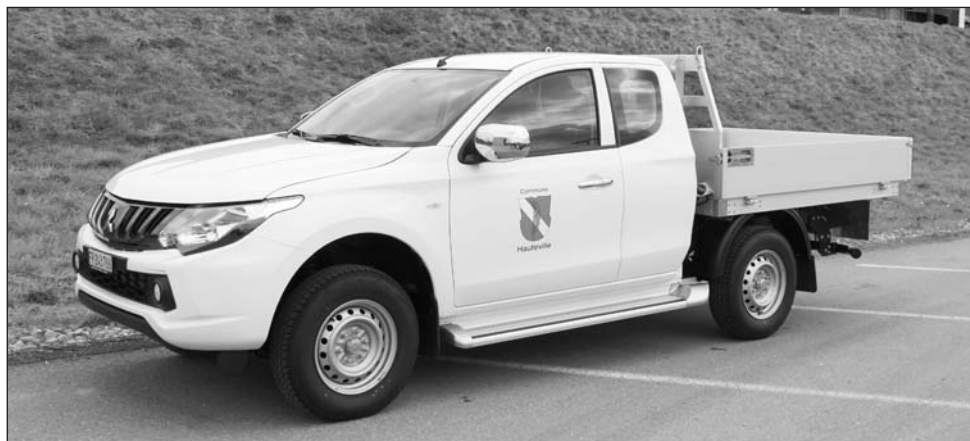
Nouveau véhicule utilitaire de la commune, un Mitsubishi L200