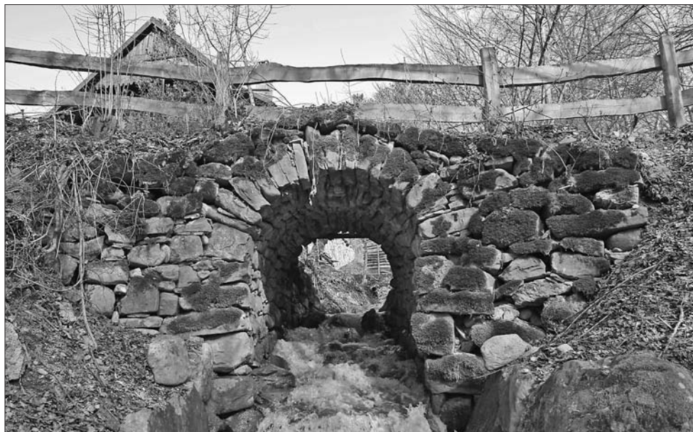
Vieux pont en pierre traversant le ruisseau des Fourches, près de la chapelle du même nom