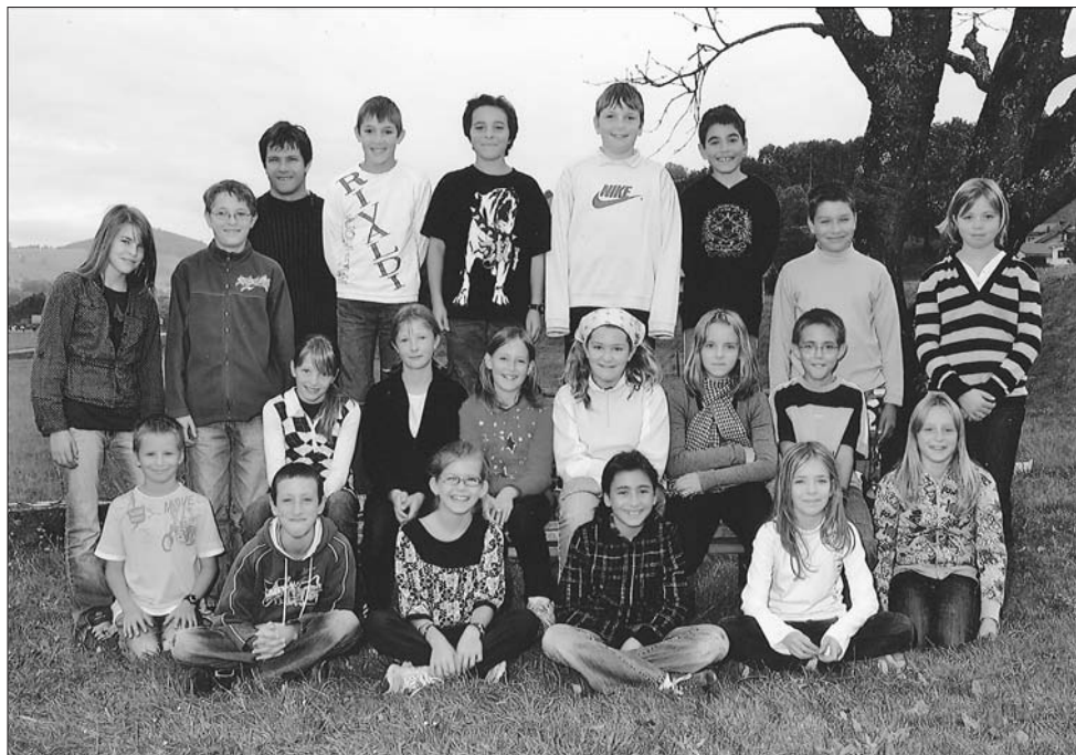
Photo des élèves de la classe 5-6P à Hauteville prise en automne 2008.

Accroupis au premier rang, de gauche à droite: